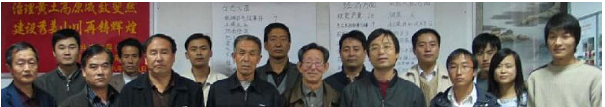
Les acteurs partie prenante de DESIRE en Chine