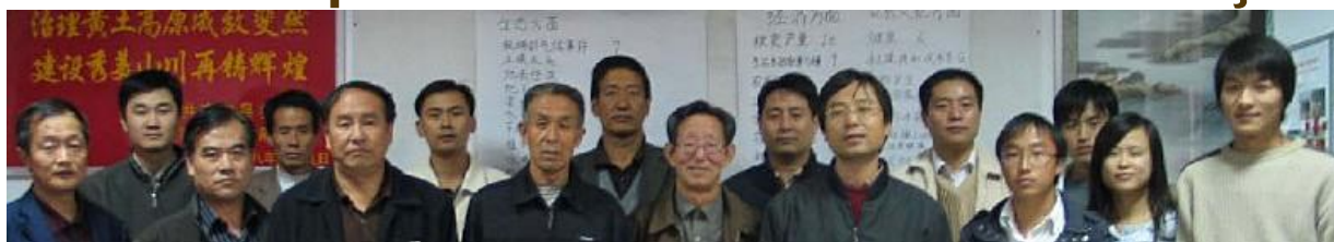
Beneficiários do DESIRE na China